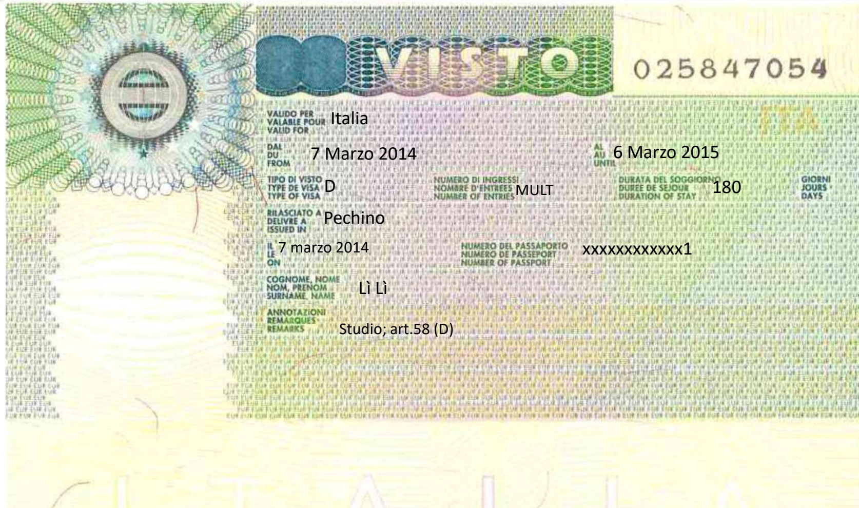
Visto (esempio di scuola)